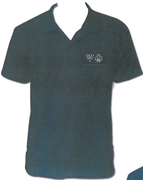
2: GUIDES AND SCOUTS OF NORWAY